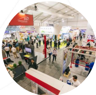
Imagen en soportes del ingreso principal de Expomin, alta circulación y exposición (Producción completa es gestión del organizador).