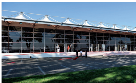
›Blankstahlhalle‹ 2.000 m 2