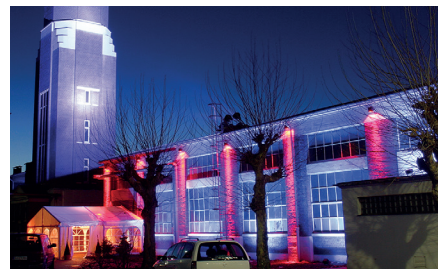
›Halle am Wasserturm‹ 600 m 2