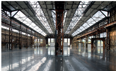
›Alte Schmiedehallen‹ 8.500 m 2