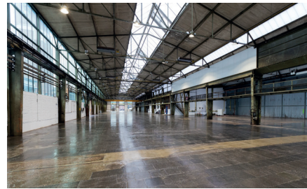
›Kaltstahlhalle‹ 3.200 m 2