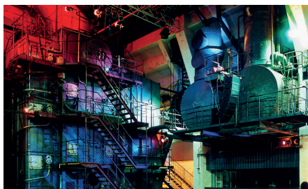
›Altes Kesselhaus‹ 1.050 m 2