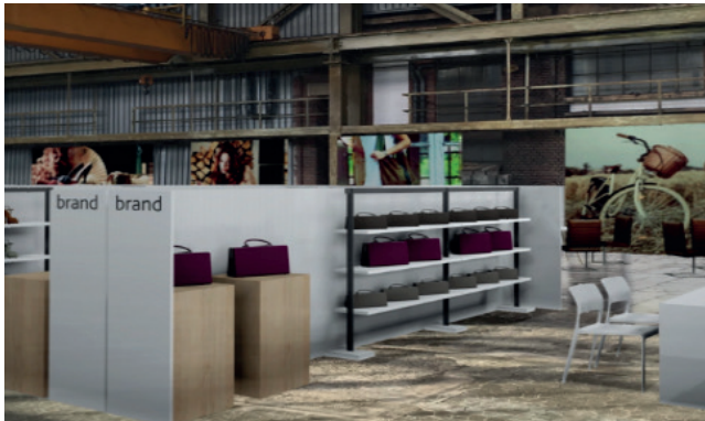
Aufbaubeispiel; weicht je nach Bereich ab Example; construction maybe different depending on the segment

Zur Erhaltung des gesamten Erscheinungsbildes bitten wir, die Einbringung von Eigenwerbung wie Poster, Roll-Up etc. auf ein Minimum zu reduzieren und eine Höhe von max. 1,60 m einzuhalten. Wir behalten uns vor, evtl. selbst eingebrachte Werbemittel zu entfernen.