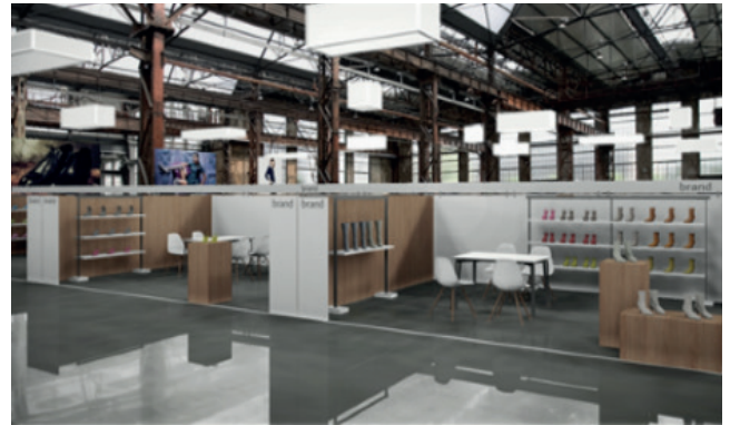
Aufbaubeispiel; weicht je nach Bereich ab Example; construction maybe different depending on the segment

We kindly ask you to preserve the overall appearance. Please reduce any kind of self-promotion, such as posters, roll-up etc., to a minimum, maximum height 1.60 m. We reserve the right to remove any advertising made by yourself.