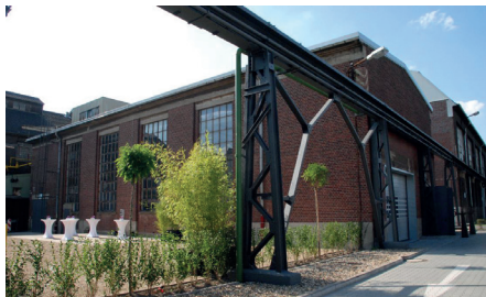
›Glühofenhalle‹ 400 m 2